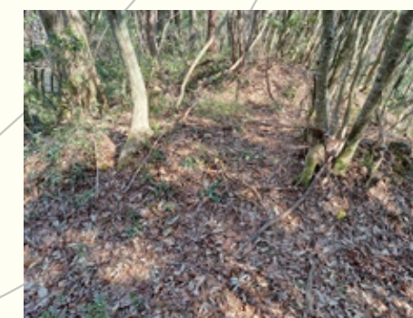
曲輪III東側の連続堀切