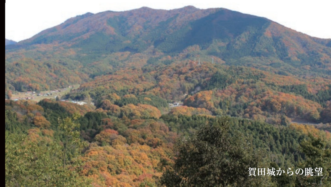
賀田城からの眺望