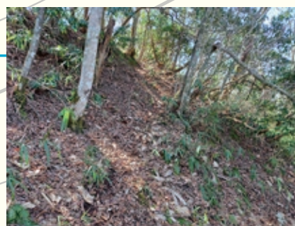
IVから主郭への虎口