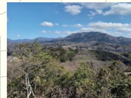
要害平から琴引山を望む

東側が見わたせ琴引山を望む II・IIIの南側は、岩が露出し 天然の要害となっている