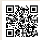
優便ポストの 説明動画はこちら